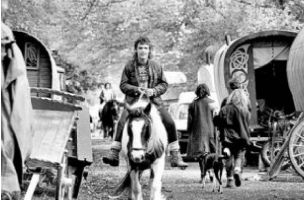
Les Travellers d'Irlande, minorité opprimée

Nous vous parlons en avril des Travellers, les gens du voyage, au sujet du film Le Cheval venu de la Mer . Voici un article écrit en décembre 2008 par Yolaine Maillet, sur quelques aspects de la condition de cette minorité nomade particulièrement opprimée. Les Travellers sont « autochtones », ils ne sont pas des Roms, mais le parallèle avec le sort des Roms en France et dans le reste de l'Europe s'impose.